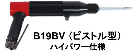
B19BV (ピストル型) ハイパワー仕様