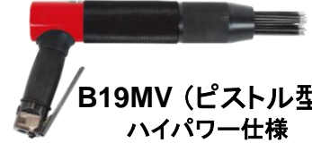
B19MV (ピストル型) ハイパワー仕様