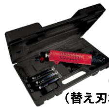
CP7901K (替え刃3セット付キット販売)