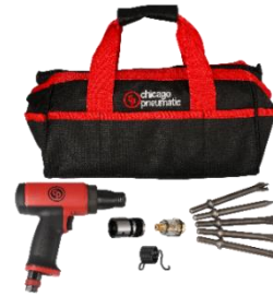
CP7160K / CP7165K (タガネ5本付キット販売)