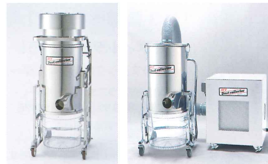
洗える集塵機は0.75kw～2.2kwまで用意しております。 ※ブロワ別置きタイプもあります。