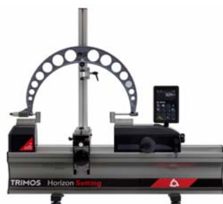
・外側マイクロメータのセッティング (治具使用)