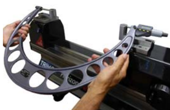
・外側マイクロメータのセッティング (手による)