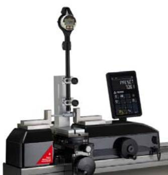
・二点式ボアゲージのセッティング (治具使用)