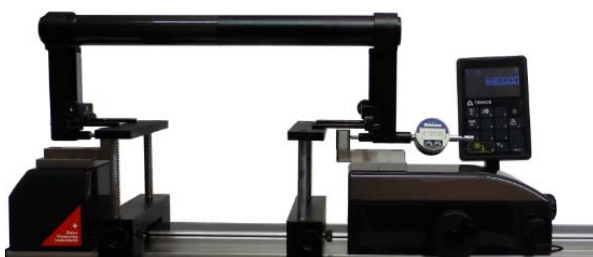
・大きなゲージのセッティング