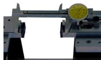
・ノギスの検査用