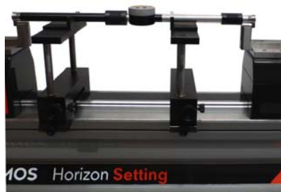
・二点式内外径比較測定機のセッティング