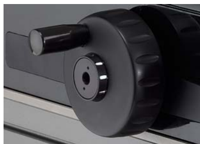
測定圧調整用ダイヤル