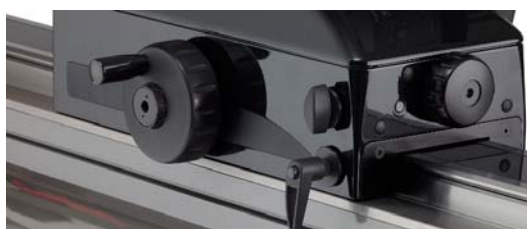
測定キャリッジ固定用に二つのロック機構を装備