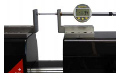
・ダイヤルインジケータの検査用