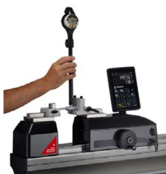
・二点式ボアゲージのセッティング (手による)